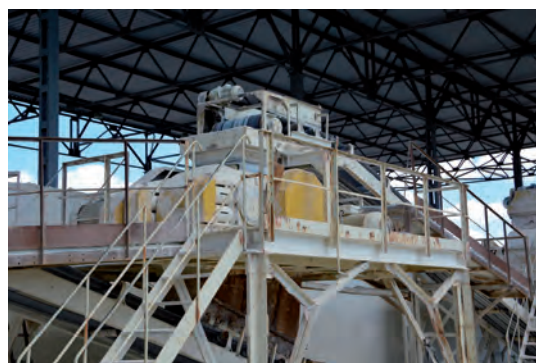
Оборудование для переработки каолина-сырца