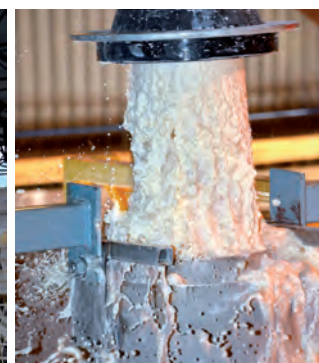
Промывание каолина после удаления песка