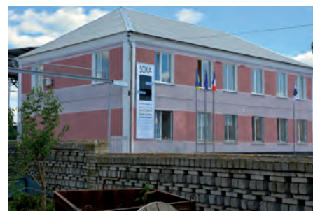
Лаборатория и офис в г. Казатин

Более ста гостей приняли участие в мероприятии, среди которых представители органов местной власти, деловые партнеры и подрядчики ООО «СОКА Украина», а также представители французского делового сообщества в Украине.