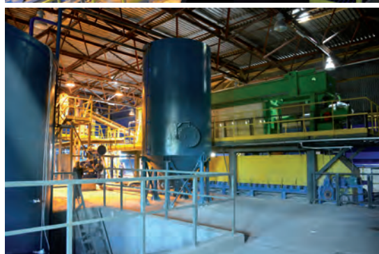
Оборудование для обогащения каолина, установленное на заводе